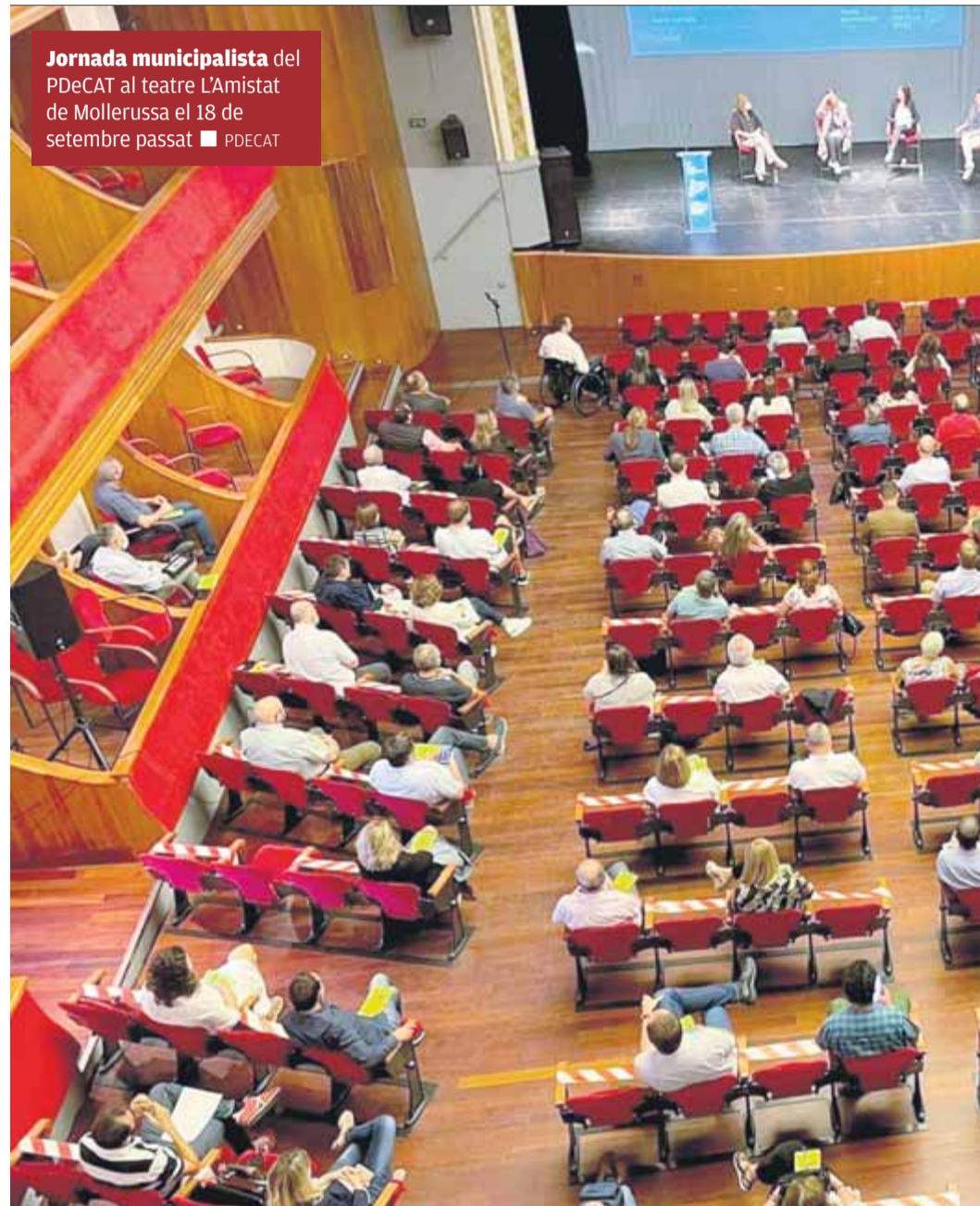
Jornada municipalista del PDeCAT al teatre L'Amistat de Mollerussa el 18 de setembre passat ■ PDeCAT

Tant des de Centrem com des de Junts destaquen que l'important no és amb quina marca es presenten aquests candidats, sinó amb qui acaben sumant els vots que obtinguin per al repartiment de càrrecs als consells comarcals i les diputacions i pels drets electorals de les següents eleccions. Fonts de Centrem posarien la mà al foc que els vots d'Impulsem el Penedès acabaran anant a parar a Junts. Seria paradigmàtic veure com els sufragis que rebí l'alcalde d'Igualada, un dels pesos pesants del