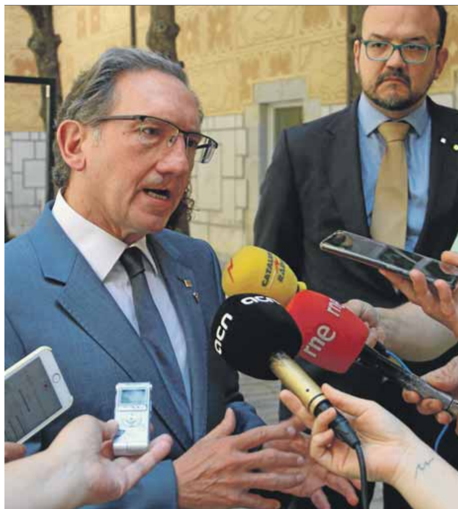
Giró, ahir, atenent els mitjans de comunicació gironins ■ ACN

Els projectes del pla s'agrupen en sis àmbits d'actuació: litoral, Besòs/Collserola, Montjuïc, oferta desconcentrada, mobilitat sostenible i innovació. ■ REDACCIÓ