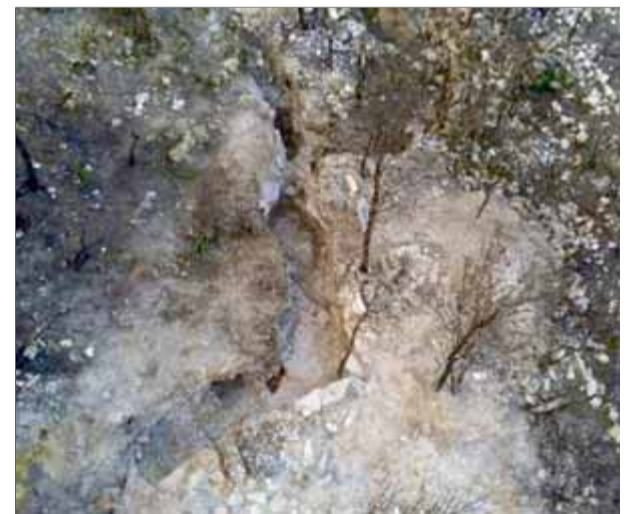
Imatge de la trinxera on s'han localitzat les restes dels soldats a Corbera d'Ebre

Des de l'any passat s'han registrat 36 informacions sobre restes òssies descobertes en superfície a tot Catalunya. ■