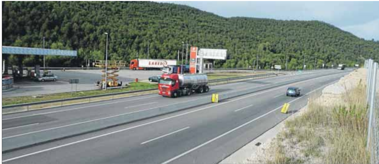
Àrea de servei a Gurb, a l'eix transversal

Ara bé, el contracte, signat el 2007, inclou una clàusula administrativa particular que preveu que la Generalitat té dret a resoldre el contracte abans del seu venciment, previst per al juny del 2040, sense haver-ho de justificar, sempre que aboni una compensació anomenada "preu de reversió", que ja estava estipulada en l'oferta. Concretament, la clàusula disposa que "l'administració podrà exercir la seva iniciativa de resolució anticipada dins de l'any natural en què es compleixin els 10, 15 i 20 anys de la notificació de